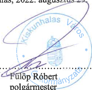
Fülöp Róbert polgármester Kiskunhalas Város Önkormányzata